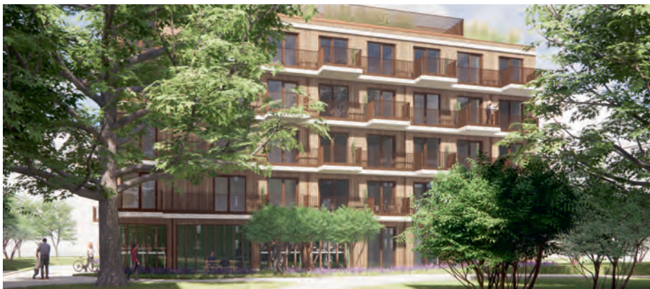
Tekening van het nieuwe woongebouw bij station Nijmegen Goffert (OZ Architect)

Deze zomer willen we starten met de bouw. Op www.woonwaarts.nl/goffert plaatsen we het laatste nieuws. Zo laten we het weten wanneer de eerste woningen op Entree verschijnen.