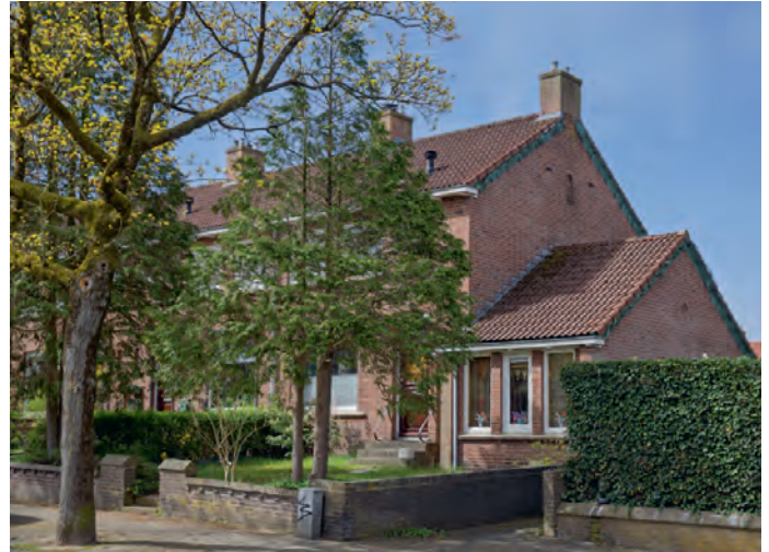
Woningen aan de Corduwnerstraat gaan we verduurzamen

Bewoners kunnen kiezen voor extra opties, zoals zonnepanelen en mechanische ventilatie. Of voor een elektrische warmtepomp waarmee ze hun woning aardgasvrij maken. Als dat een stap te ver is, kunnen ze kiezen voor een zwaardere aansluiting van de meterkast. Daarmee maken ze de overstap naar elektrisch koken. In sommige woningen plaatsen we een nieuwe badkamer, keuken en toilet. Dat doen we alleen als die verouderd zijn én als bewoners dat dan willen.