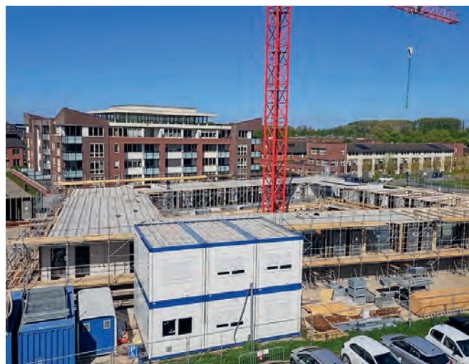
De bouw aan de Marktschuitstraat is in volle gang