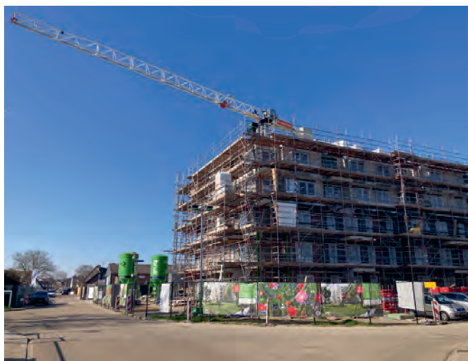
Het hoogste punt is al bereikt bij de woningen aan de Karel Doormanstraat

Meer informatie: www.woonwaarts.nl/t-erf