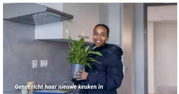
Genet richt haar nieuwe keuken in