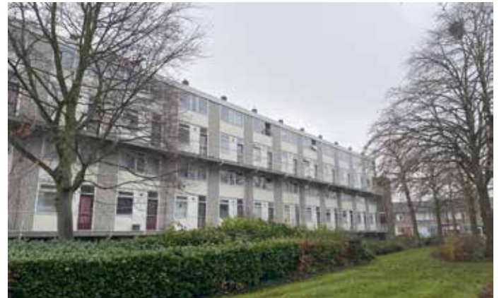
De huidige maisonnettes aan de Balladestraat worden gesloopt

Vervolgens werken we in fases aan een nieuwe buurt in Neerbosch-Oost, een wijk die klaar is voor de toekomst.